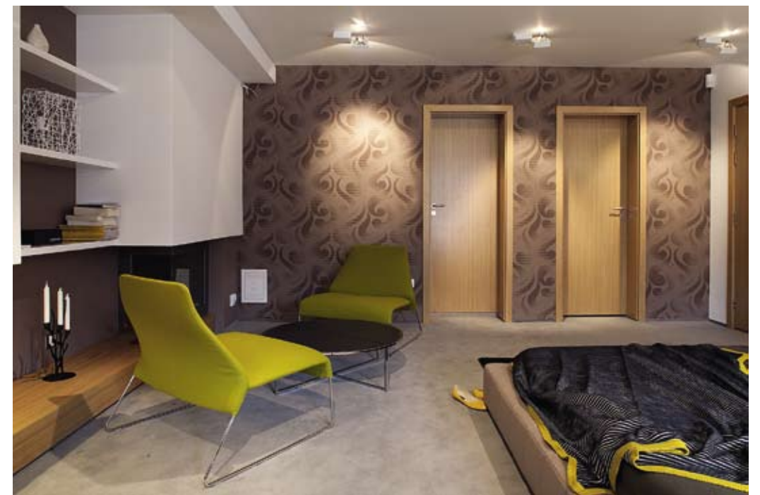
ОСНОВНАТА СПАЛНЯ С ГАРДЕРОБНА И БАНЯ КЪМ НЕЯ СЕ НАМИРА НА ПЪРВОТО НИВО. ОКОЛО 40 КВ.М С КАМИНА И ТЕРАСА КЪМ ПЛАНИНАТА, С КИНОЕКРАН СРЕЩУ ЛЕГЛОТО