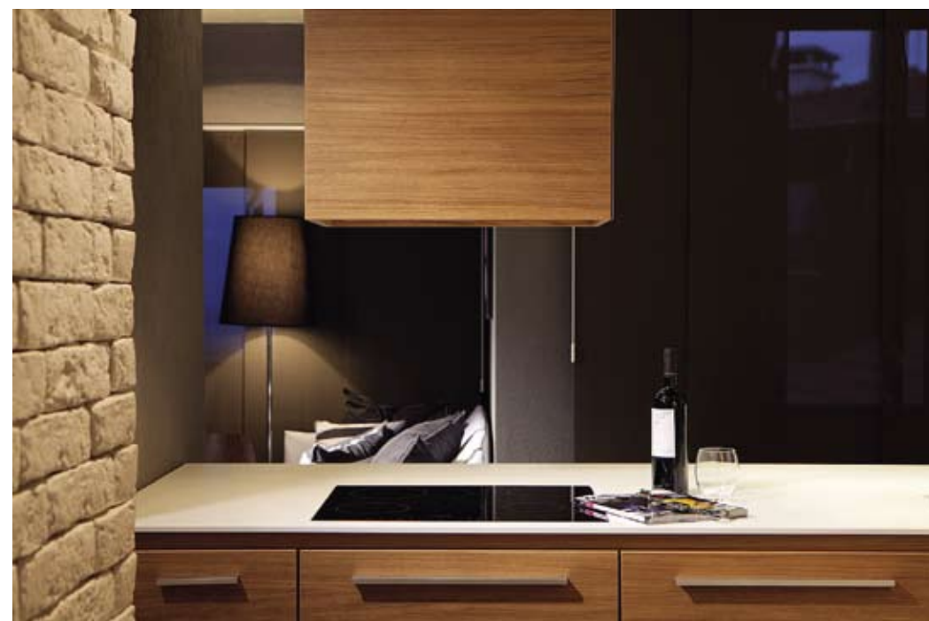
КАМИНАТА ОТДЕЛЯ КУХНЕНСКИЯ ОСТРОВ, УДОБЕН ЗА ЗАКУСКА И ПИТИЕ ПРЕДИ ВЕЧЕРЯ. В НИШАТА - КЪТ ЗА УСАМОТЕНИЕ, НО С ВИДИМОСТ КЪМ ВСЕКИ ЪГЪЛ; ДИВАНЪТ СЕ РАЗТЯГА